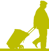
Die 3 Standorte des Heimatmuseums – Nr. 3